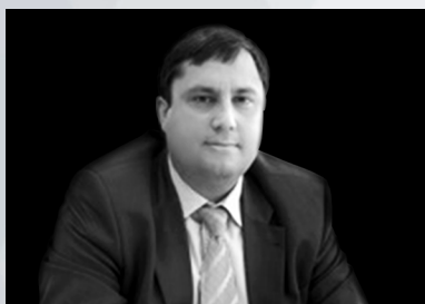
ТИМОФЕЙ НИЖЕГОРОДЦЕВ Начальник Управления контроля социальной сферы и торговли ФАС России